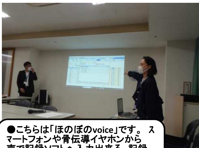
●こちらは「ほのぼのvoice」です。スマートフォンや骨伝導イヤホンから声で記録ソフトへ入力出来る。記録情報をその場で聴くことができるというものです。学習会の様子です●